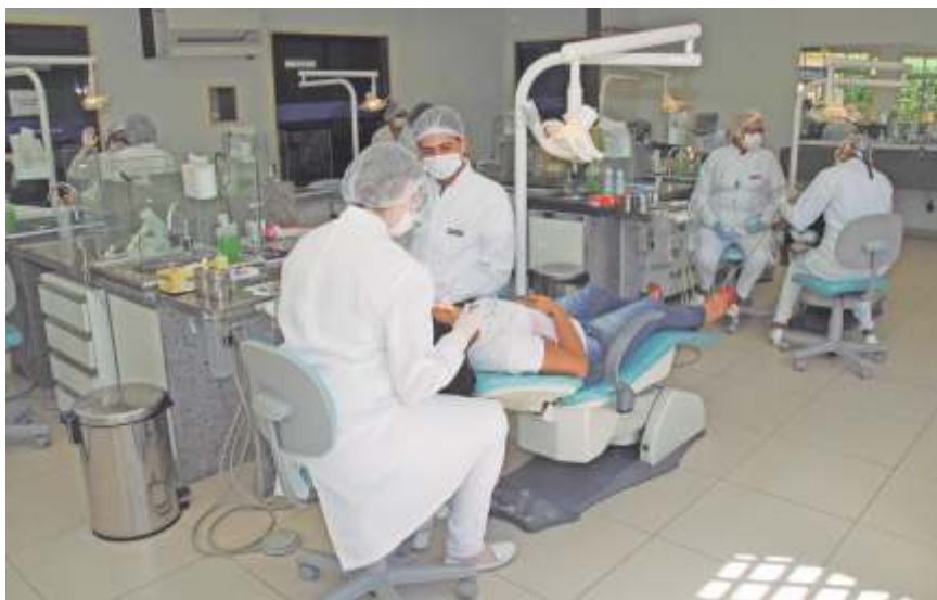
Serviço odontológico aos associados a preços convidativos

Entre os serviços nesta área, acontece o Happy Hour – uma ação musical realizada todas as sextas-feiras, trazendo bandas e cantores, promovendo um momento de integração qualitativa e