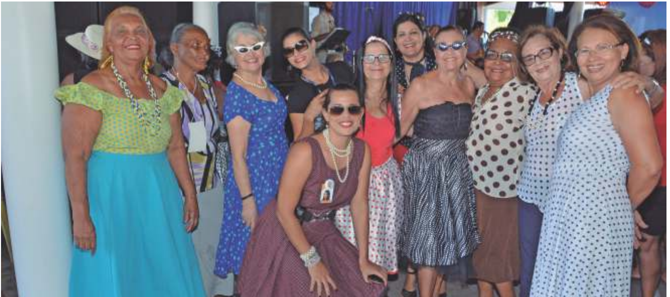
Grupo do TSI e participantes no Baile Retrô, na Unidade Sesc Guaxuma

Com o objetivo de promover troca de experiências, o XXI Ciclo Sesc de Palestras e Vivências ao Idoso capacitou idosos e profissionais da área