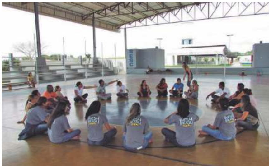
Multiplicadores em capacitação do Programa Mesa Brasil Sesc

Urbana, onde recolhe os alimentos nas empresas doadoras – não recebendo alimentos prontos, recheados e fora da validade, e transporta até os Bancos de Alimentos – situados em Maceió e Arapiraca, onde seleciona, armazena e distribui, de acordo com os critérios estabelecidos pela equipe técnica, para que as instituições cadastradas possam recolher.