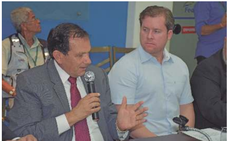
Durante o evento, Malta anunciou que Alagoas terá um Centro de Gastronomia

Dentre outros pontos que o ministro antecipou está a MP para regular a conectividade aérea, que é um problema no Nordeste. “Temos mais leitos do que voos operando no Nordeste, apesar de não ser uma pauta específica do turismo; mas da ANAC. Em parceria com a ANAC desenvolvemos uma outra MP para poder transformar o setor mais competitivo, regulando a questão do