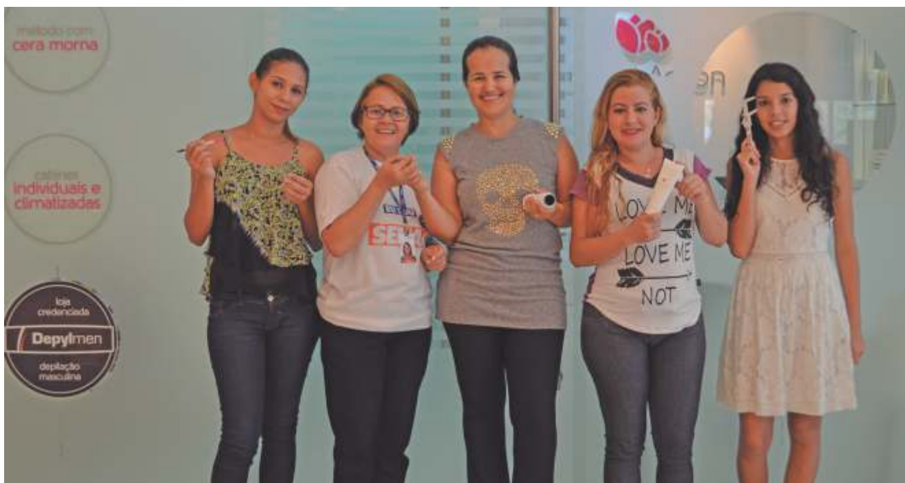
Aulas dos cursos de Design de Sobrancelhas com Henna e Depilação Egípcia (Linha) foram realizadas na própria loja

Franquia de empresa especializada em depilação segue indicação da rede e encontra no Senac a qualificação que buscava para atender à nova demanda