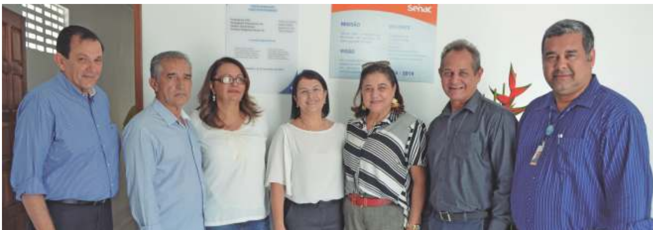
Parceiros e comerciários prestigiaram a inauguração do Posto Avançado

Senac Alagoas inaugura Posto Avançado em União dos Palmares. Solenidade de abertura foi realizada no dia 22 de novembro