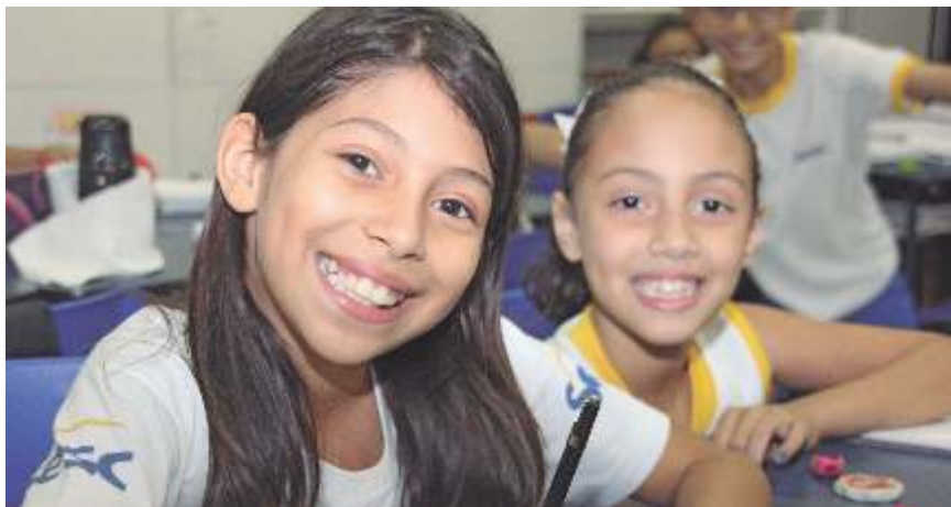
Alunos em sala de aula na Unidade Educação Sesc Jaraguá

fortificando a música brasileira. Outra ação e tradicional, é o Brincando no Sesc, trata-se de uma colônia de férias realizada no mês de janeiro, onde as crianças vivenciam atividades por meio de oficinas, torneios esportivos, brincadeiras, passeios entre outras, realizadas na unidade Sesc Guaxuma.