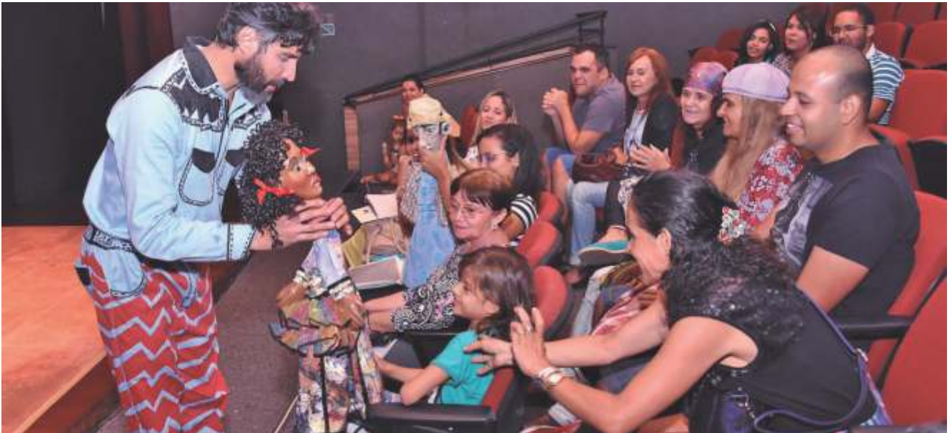
Espectáculo Palco Giratório

Com Saúde, Educação, Cultura, Lazer e Assistência, Sesc estimula o desenvolvimento da cidadania e contribui para a melhoria da qualidade de vida