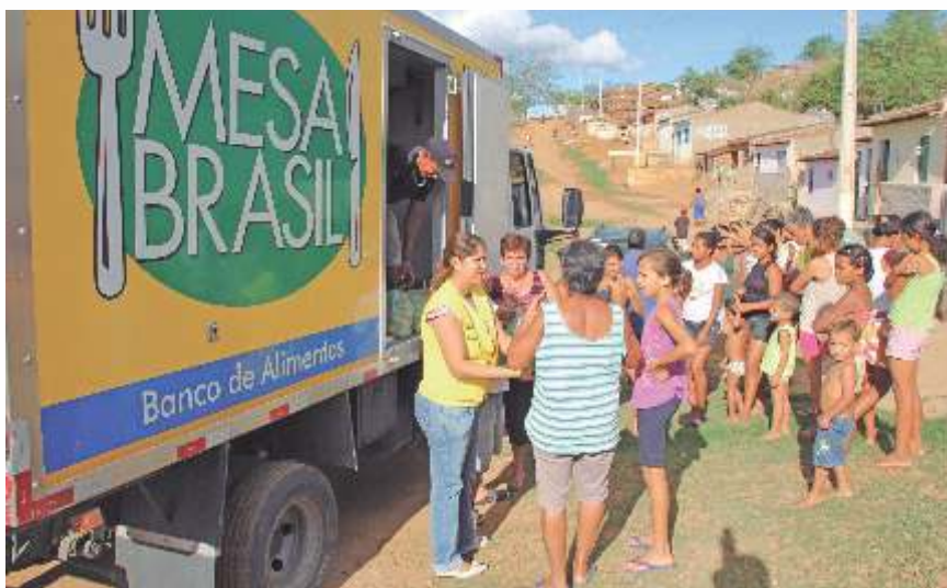
Equipe do Programa Mesa Brasil Sesc distribuindo alimentos nas comunidades

A estrutura do Programa na sua funcionalidade logística acontece na modalidade Banco de Alimento e Colheita