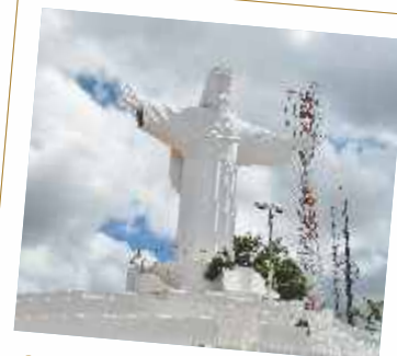
Cristo Redentor, na Serra do Goiti

Inaugurado em 1971, tem como sede a Igreja do Rosário e, apesar do nome homenagear os primeiros habitantes do lugar, não é um museu exclusivamente de acervo indígena, contendo itens sacros, arqueológicos e regionais; um verdadeiro conjunto de bens representativos da população local e nordestina.