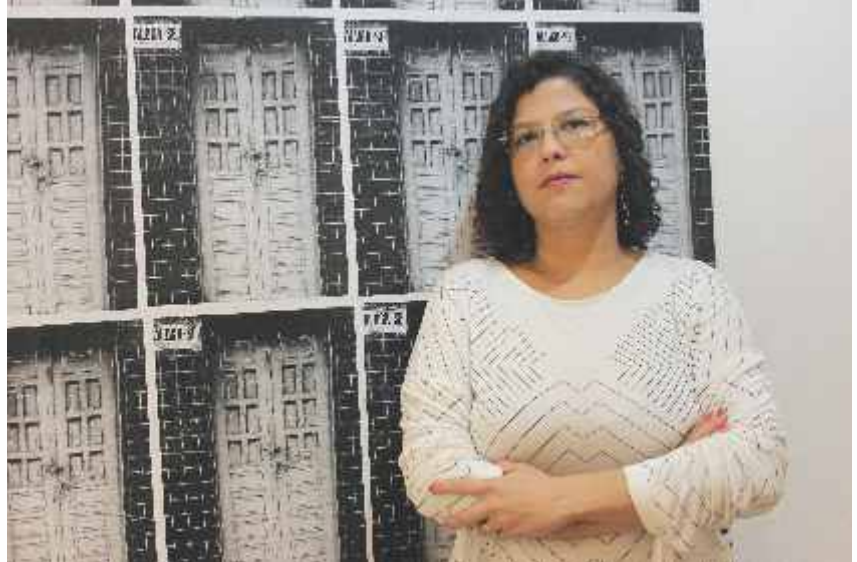
A exposição retrata a situação dos moradores do Pinheiro e do Mutange