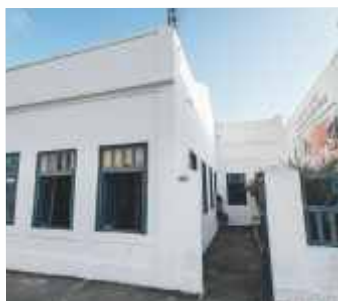
Casa Museu Graciliano Ramos