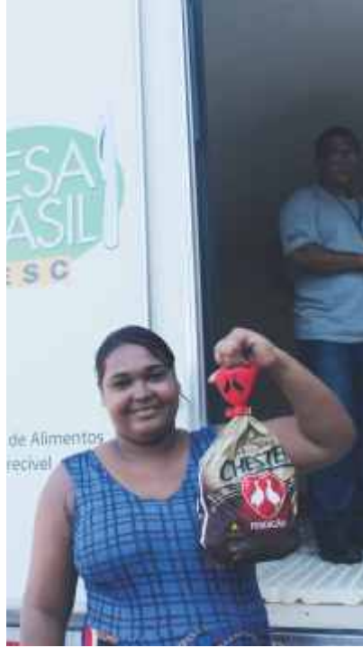
Mesa Brasil atende 50% dos municípios de AL