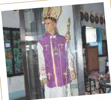
Museu de Arte e História da Tribo Xucuru