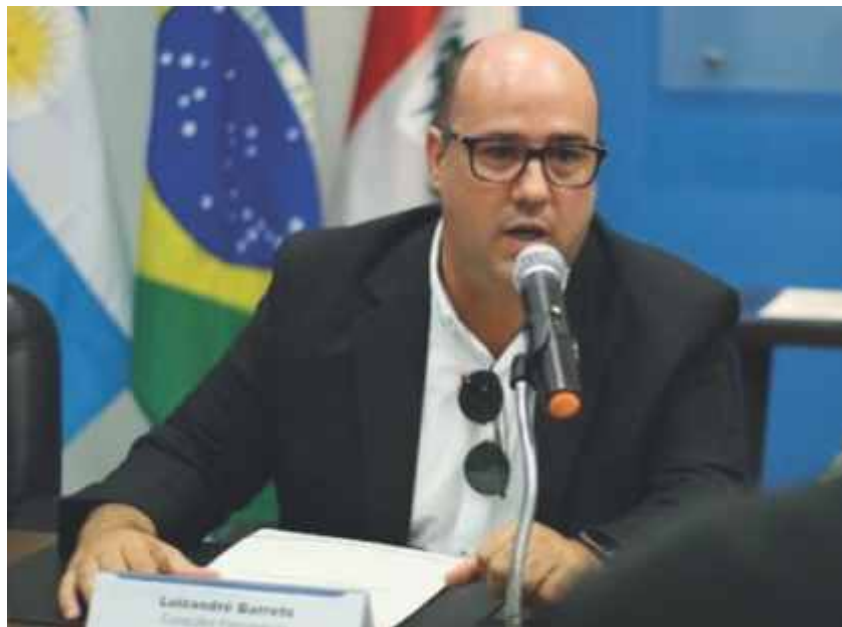
Segundo o consultor, Alagoas tem um ambiente favorável para importação

O acesso a esse mercado externo, rico em novas tendências, o aumento da margem de lucro por meio da redução dos custos e o desenvolvimento de novos produtos visando au-